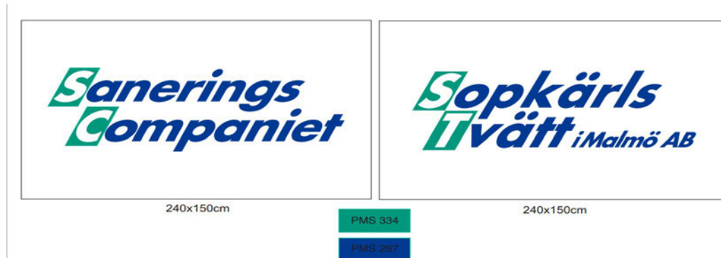
Bild 1. Sanerings Companiets och Sopkärlstväts logotyper